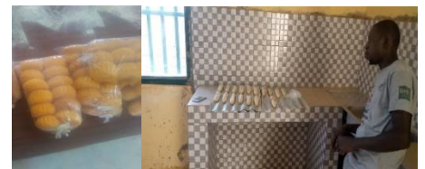
Production de Pains et Gâteaux